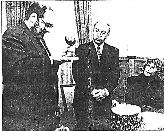
Eco fue homenajeado por la Xunta, en cuyo nombre recibió un Pelegrin de plata

en el V Congreso Internacional de la Asociación Española de Semiótica, reunido desde el pasado jueves en el Palacio de Congresos de esta ciudad. El escritor afirmó que «es necesario implantar una lengua vehicular como el esperanto», y criticó «la inexistencia de una decisión política» para que la aplicación de esta lengua sea posible. Eco participó en este congreso